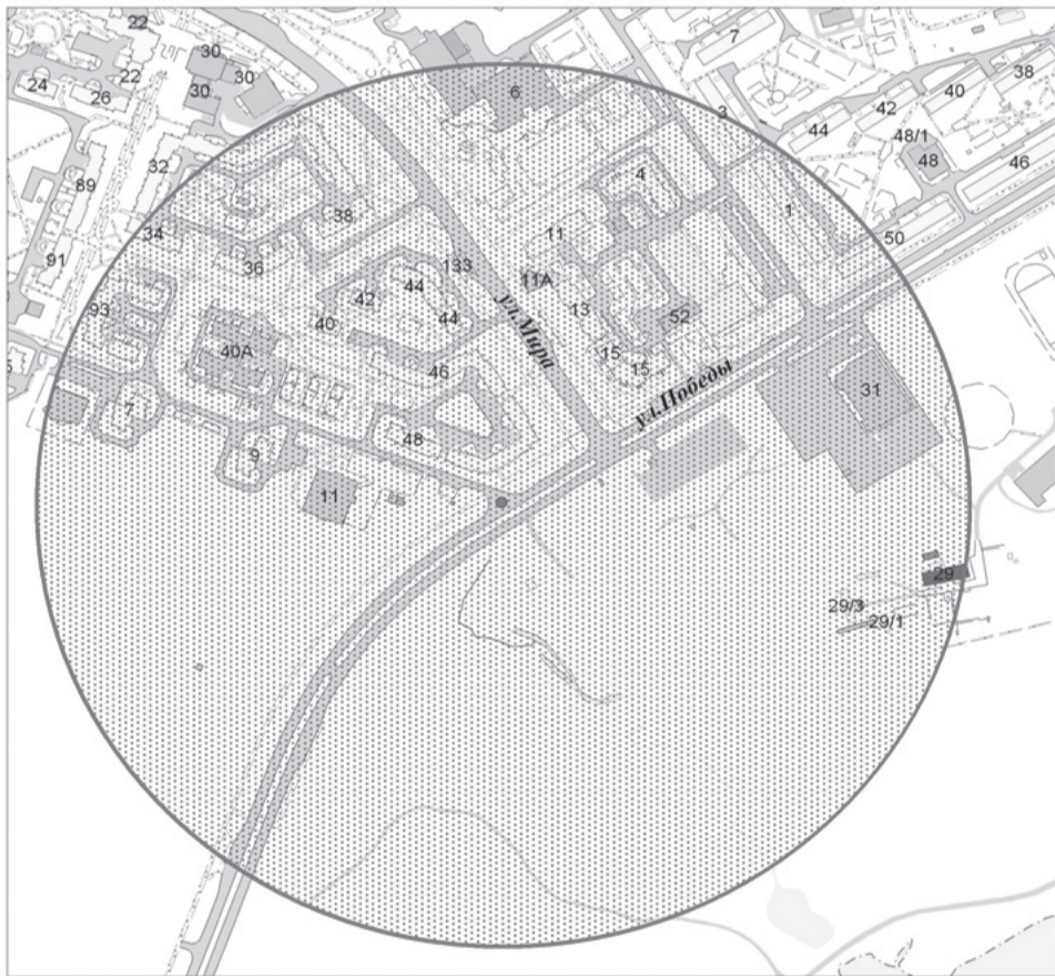
СХЕМА границ места проведения городской комбинированной эстафеты, посвященной Году единства народов России, в 2026 году, и прилегающей территории

Муниципальное казенное учреждение «Управление городского хозяйства»