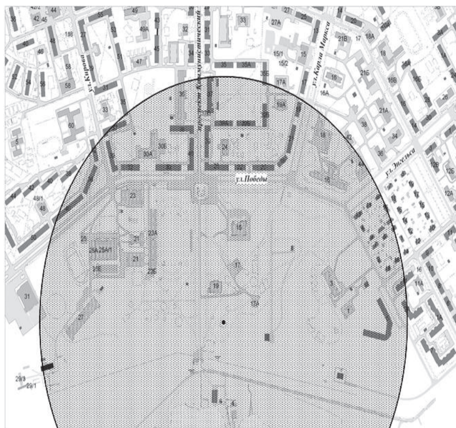
СХЕМА ГРАНИЦ МЕСТА ПРОВЕДЕНИЯ ГОРОДСКИХ МЕРОПРИЯТИЙ, ПОСВЯЩЕННЫХ ПРАЗДНОВАНИЮ 76-Й ГОДОВЩИНЫ СО ДНЯ ПОБЕДЫ В ВЕЛИКОЙ ОТЕЧЕСТВЕННОЙ ВОЙНЕ 1941-1945 ГОДОВ, И ПРИЛЕГАЮЩЕЙ ТЕРРИТОРИИ

Приложение № 2 к постановлению главы городского округа «Город Лесной» от 04.05.2021 № 39 Утверждена постановлением главы городского округа «Город Лесной» от 12.04.2021 № 30 «О подготовке и проведении мероприятий, посвященных 76-й годовщине со Дня Победы в Великой Отечественной войне 1941-1945 годов»