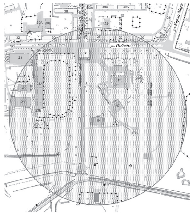
СХЕМА ГРАНИЦ МЕСТА ПРОВЕДЕНИЯ ГОРОДСКОГО НАЦИОНАЛЬНОГО ПРАЗДНИКА «САБАНТУЙ» НА ТЕРРИТОРИИ ГОРОДСКОГО ОКРУГА «ГОРОД ЛЕСНОЙ» В 2021 ГОДУ

УТВЕРЖДЕНА постановлением администрации городского округа «Город Лесной» от 22.06.2021 № 462 «О подготовке и проведении городского национального праздника «Сабантуй» на территории городского округа «Город Лесной» в 2021 году»