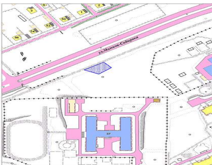
Схема места, специально отведенного для выгула собак вдоль ул. Мамина - Сибиряка, в районе МБОУ СОШ № 75

место для выгула собак место для выгула собак